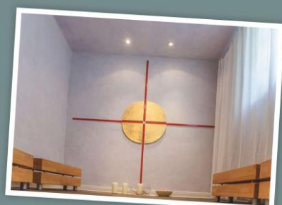
Raum der Stille