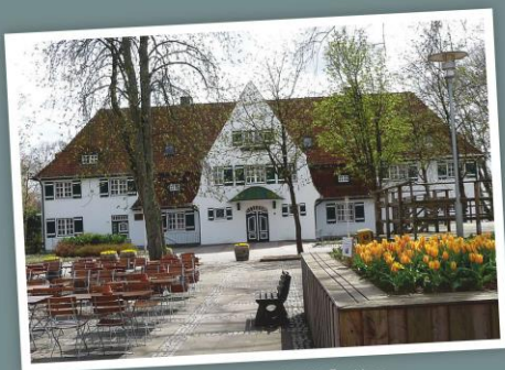
Haupthaus mit 51 Betten

4. bis 7. November 2019 Koppelsberg am Plöner See