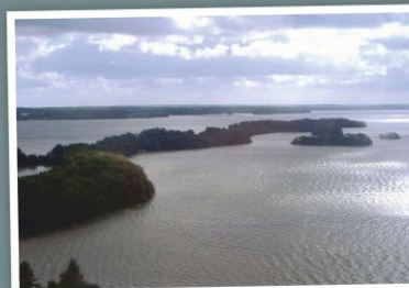
Blick auf die Prinzeninsel