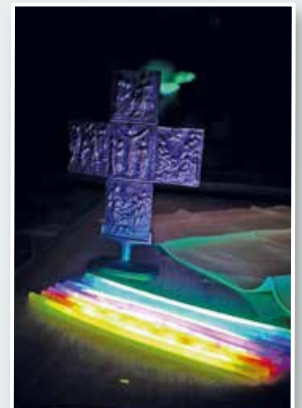
Andacht mit Gebet

Wir Christen beten Hand in Hand für Gottes Segen im ganzen Land.