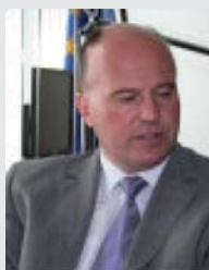
Hartmut Koschyk MdB (CSU)