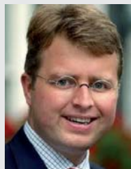
Gespräch mit Frank Schäffler MdB (FDP)