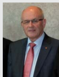
Volker Kauder (CDU)