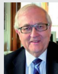
Rainer Brüderle (FDP)