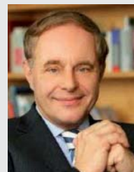
Jörg van Essen MdB (FDP)