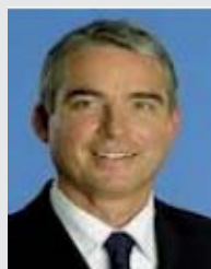
Thomas Strobl MdB (CDU)