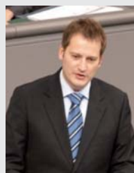
Manuel Höferlin MdB (FDP)