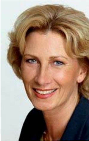
Anita Klamm, FDP

Funktionen: Mitglied des Landtages Schleswig-Holstein, Landtagsvizepräsidentin, sozialpolitische Sprecherin der FDP-Fraktion